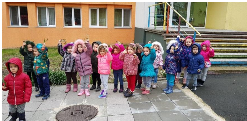
І-ва група „Моряче“ – ДГ „Звездица-Зорница“