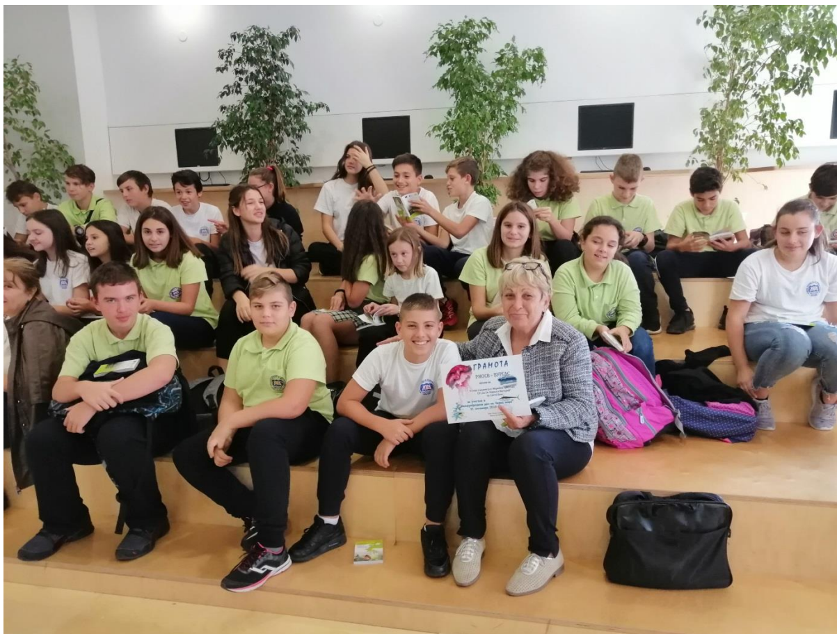
Възпитаници на ОУ "Св.св. Кирил и Методий" в гр. Свети Влас участваха във викторина за Черно море. Ученици от V, VI и VII клас, получиха грамоти и предметни награди, осигурени от екоинспекцията.