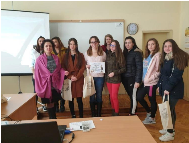
ПГХТ „Акад. Н. Д. Зелинский“ – 9 клас

РИОСВ-Бургас проведе редица открити уроци по повод Световния ден на влажните зони – 2 февруари, в училищата ОУ „Антон Страшимиров“, ПГХТ „Акад. Н. Д. Зелинский“ и ПГЧЕ „Васил Левски“. Експерт по биоразнообразие от инспекцията разказа за ролята на влажните зони и за характерни видове птици и растения. Това провокира децата да дискутират по темата „Влажни зони и климатични промени“, която е мото на кампанията за тази година.