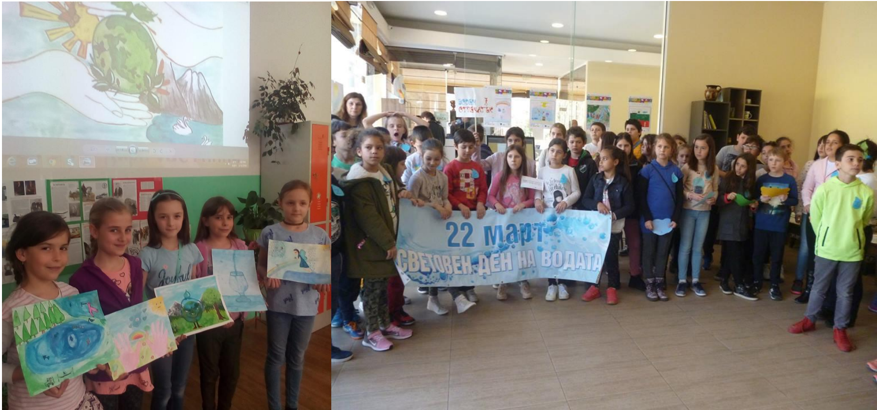
„Воден отпечатък – 7“ – ТК „Аква Калиде“