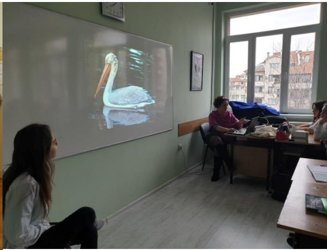
ПГЧЕ „Васил Левски“ – 11 клас