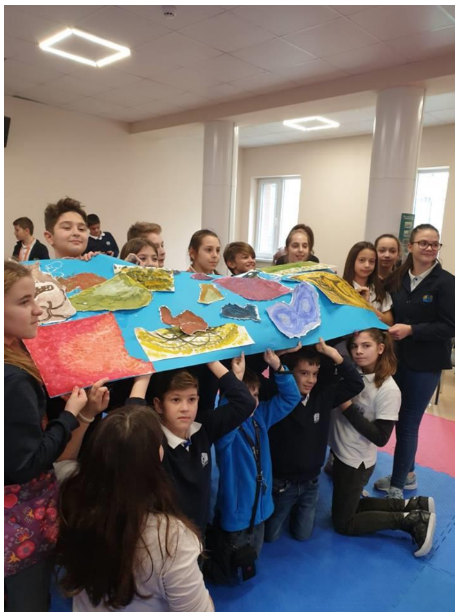
5 и 6-ти клас от ОУ „А. Г. Коджакафалията“