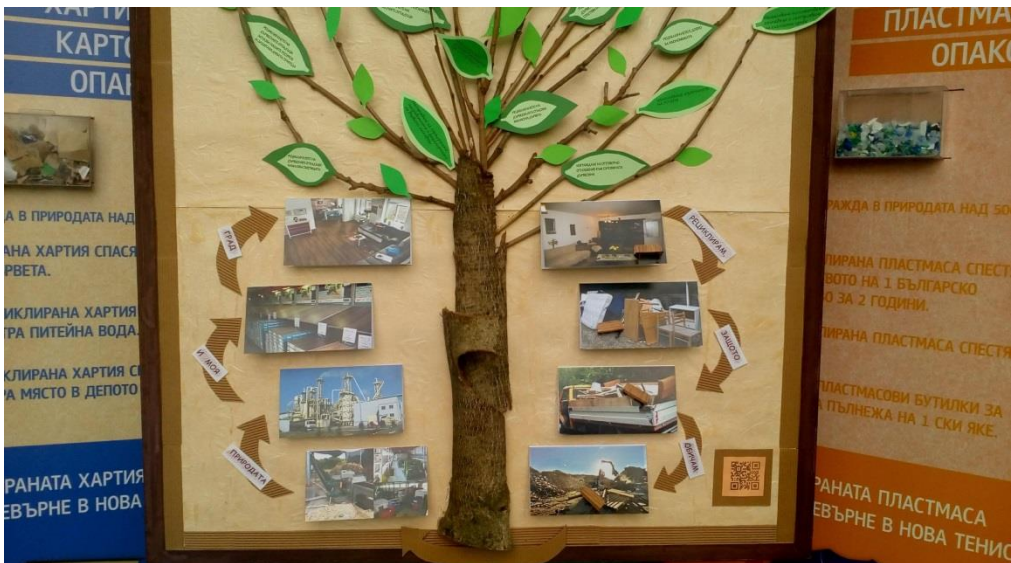
2-ра награда – 2 000 лева – ОУ „Александър Георгиев - Коджакафалията“